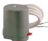
Siłownik termo-elektryczny R473