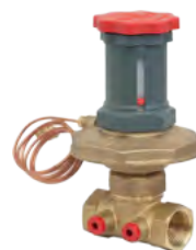
Zawór równoważący statyczny R206B