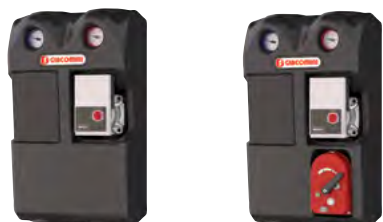
Rozdzielacz z funkcją sprzęgła R586SEP