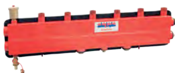
Rozdzielacz z podmieszaniem R577F-1