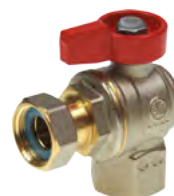
Zawór kulowy R254P-1 / R251P-1